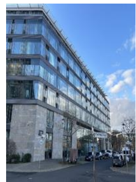
Abbildung 1: Englische Straße