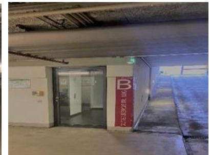
Abbildung 7: Fahrstuhl