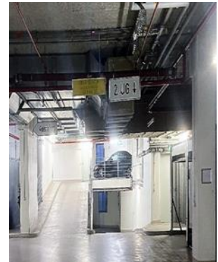
Abbildung 5: 2.&1. UG