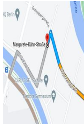
Abbildung 4: Margarete-Kühn-Straße

Bitte geben Sie in das Navigationssystem die Gutenbergstr. 15, 10587 Berlin ein. Die Tiefgarage der avodaq AG befindet sich in der Margarete-Kühn-Straße, Ecke Gutenbergstraße. Klingeln Sie bitte vor der Schranke (gelber Kasten) bei der avodaq AG. Sie erhalten nun einen Parkplatzausweis, der Ihnen den Zutritt in das Innengebäude ermöglicht. Fahren Sie nun in die Einfahrt und halten Sie sich anschließend rechts. Eine Parkplatzzuweisung im 1. oder 2. UG erhalten Sie von uns persönlich (Abbildung 5). Nach dem Parken folgen Sie den Pfeilen Richtung Ausfahrt. Sie sehen auf der linken Seite (Abbildung 6) eine Treppe. Diese befindet sich neben der Einfahrt. Der Fahrstuhl befindet sich im roten Aufgang B. Bitte nutzen Sie nun links neben der Tür, Ihren Parkplatzausweis, um das Öffnen der Tür zu ermöglichen. Sie können sich an Abbildung 7 orientieren. avodaq AG befindet sich im 5. OG.