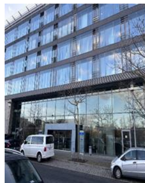
Abbildung 2: Eingang

Am Hauptbahnhof die S3 oder S9 (S Spandau BHF), S5 (S Westkreuz) oder S7 (S Potsdam Hauptbahnhof) nehmen und vier Minuten bis „Tiergarten“ fahren. Ab dort sind es dann noch zehn Minuten Fußweg: Den Ausgang nehmen und auf der Bachstraße nach Norden gehen und die Straße überqueren. Rechts auf die Wegelystraße abbiegen und anschließend links auf die Englische Straße abbiegen. Nun noch rechts abbiegen, dann befinden Sie sich auf der Gutenbergstraße. Das Berliner avodaq Office finden Sie auf ihrer linken Seite. Sie können sich an den Abbildungen 1 und 2 orientieren.