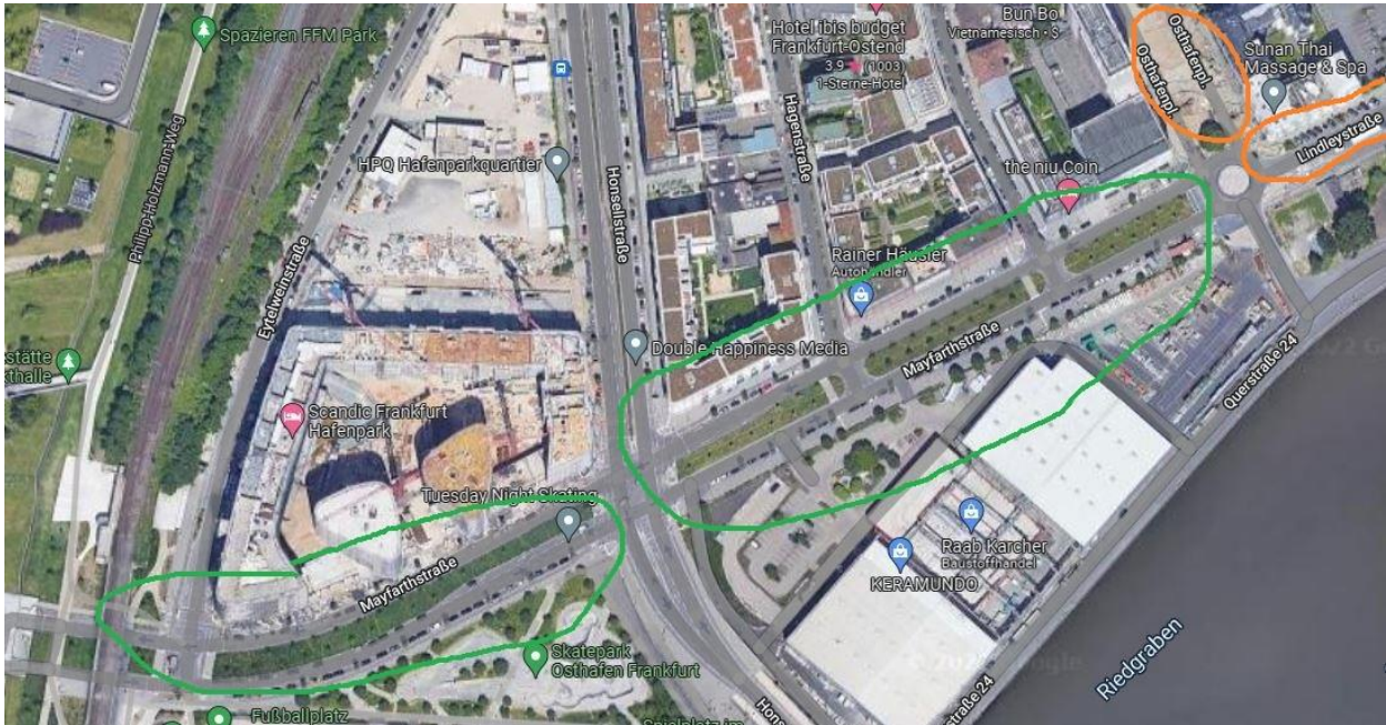
Abbildung 3: Alternative Parkmöglichkeiten