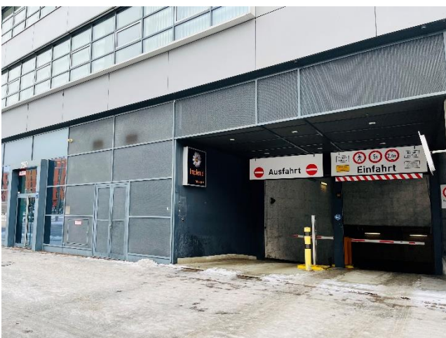
Abbildung 3: Einfahrt in die Tiefgarage